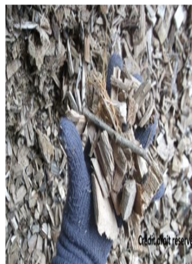
Mélange d'écorces qui alimentent la chaufferie