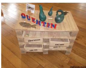
Voilà un exemple d'œuvre réalisée par les employés des ateliers du coin de Montceau Les Mines

Ils possèdent également une page facebook : https://fr-fr.facebook.com/atelierducoin71/