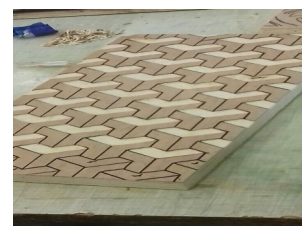
Exemple de planche utilisée pour une future impression